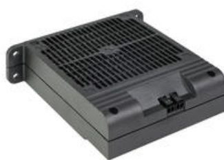
HVI030 bez ventilátoru na DIN lištu